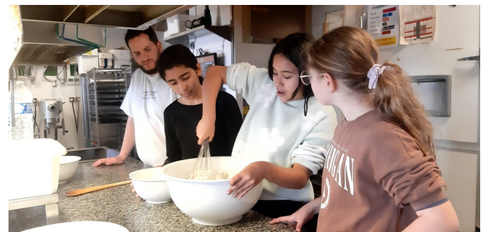
Découverte des métiers de l'artisanat pour les Skwatts, atelier pâtisserie grâce à la boulangerie Genillon