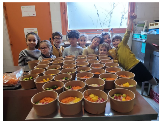
Les baos ont préparé leur repas. Au menu: Poke bowl!