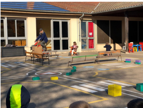
Initiation au code de la route à l'occasion d'un jeu spécial St Valentin